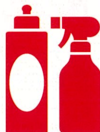
洗剤・洗浄剤・漂白剤